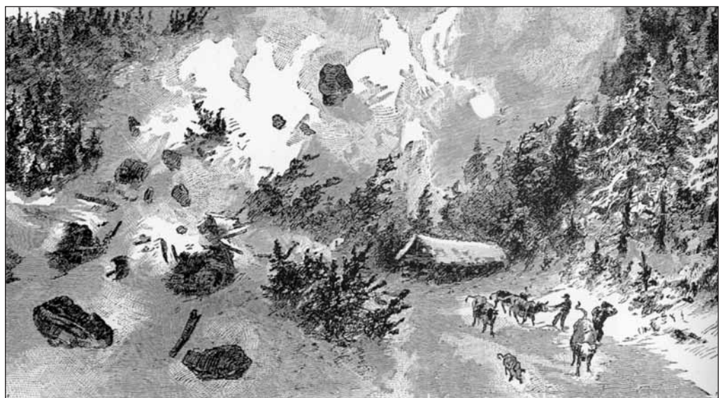
La valanga da una stampa ottocentesca

Di quella tragica giornata si ricordano anche episodi