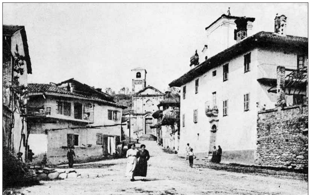
Montalenghe Piazza Vittorio Emanuele II in una vecchia cartolina

Nella seconda metà del secolo, anche in Canavese con la riforma ed il nuovo regime, il mondo della cultura e delle arti è pervaso dallo spirito romantico, dal gusto naturalistico e dall'interesse per la storia (basti ricordare la "Scuola di Rivara" di cui Carlo Pittara fu il più insigne esponente, Alfredo d'Andrade, Antonino Bertolotti, Giuseppe Giacosa per ricordare i personaggi più noti). Ormai la visione neoclassica manifestatasi nella pittura e nella scultura con richiami ai motivi mitologici, o di un'architettura legata a criteri di fredda