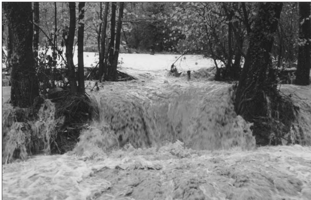
La furia del torrente Levona in V. Chiatello il 6 novembre 1994

vazioni per attingere acqua dal torrente Levona.