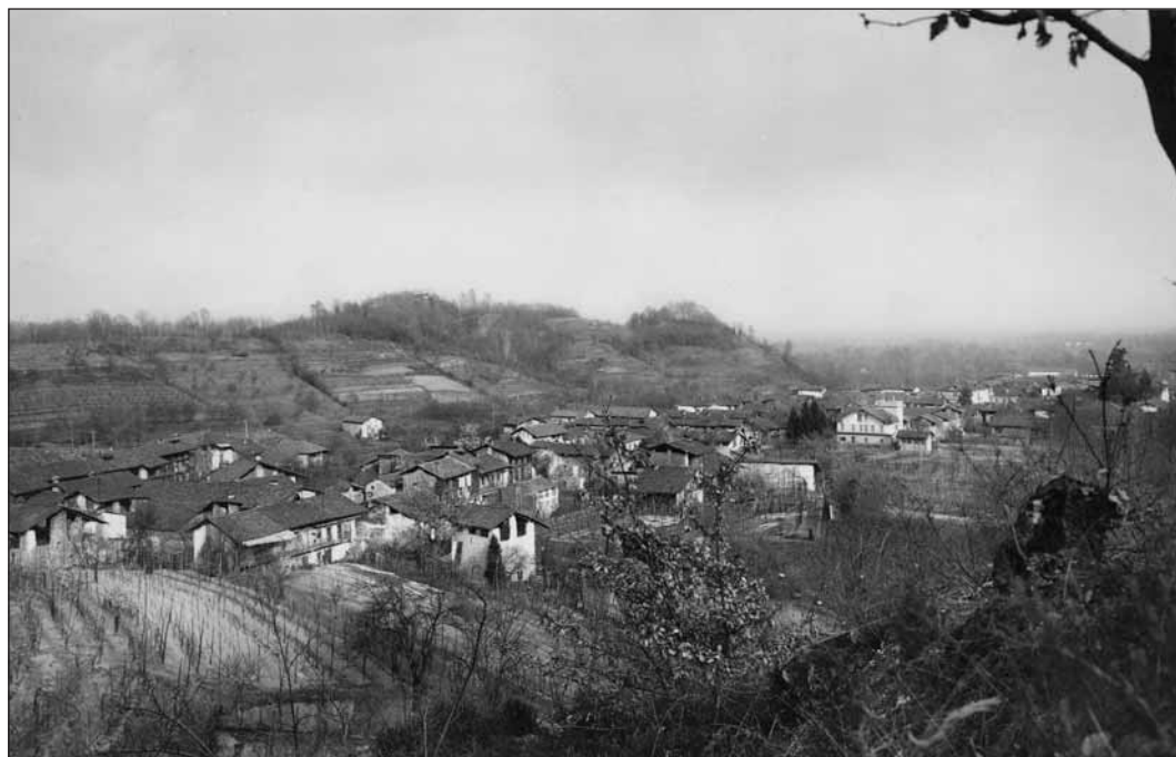
Panorama del paese

Superato l’abitato di Levone, il torrente riceve le acque del rio Bardassano e del rio Margaula, poi obli-