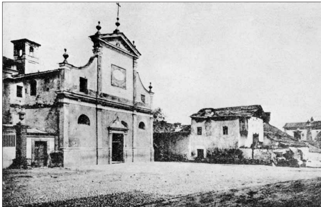
Levone - piazza S. Giovanni

qua verso la frazione Gianotti, nelle cui vicinanze, in territorio comunale di Barbania, confluisce nella Viana, affluente del Malone.