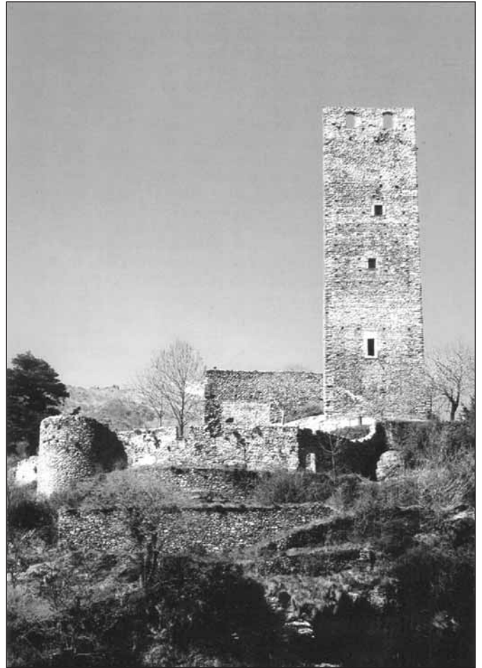
La torre Ferranda

Le controversie permangono per tutto il secolo successivo. Nel 1324, con la mediazione dei Savoia, i due rami famigliari stipulano finalmente un patto di non belligeranza, ma la pace dura poco. I contrasti sfociano infatti nella cosiddetta Guerra del Canavese (1339-