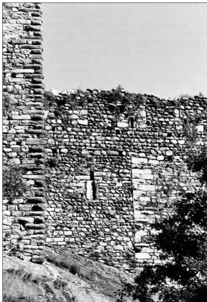
Resti del castello dei Valperga

Sul finire del XII secolo sull'abitato vegliavano tre castelli, tutti appartenenti ai Conti del Canavese, ma due appannaggio del ramo dei San Martino, uno di quello dei Valperga. I primi disponevano del Castrum Tellarium , situato a monte dell'abitato, sulla rupe che sovrasta la strada che porta alla valle Orco. Di quella struttura oggi resta una torre, proprietà di privati e non visitabile. Ai San Martino apparteneva inoltre il Castrum Pontis , situato sul dosso più a valle costituito da uno sperone roccioso che si erge di una cinquantina di metri rispetto al terreno circostante, in posizione di controllo sulla valle; di qui lo sguardo può spaziare per chilometri fin verso la pianura di Cuornè. Oggi resta