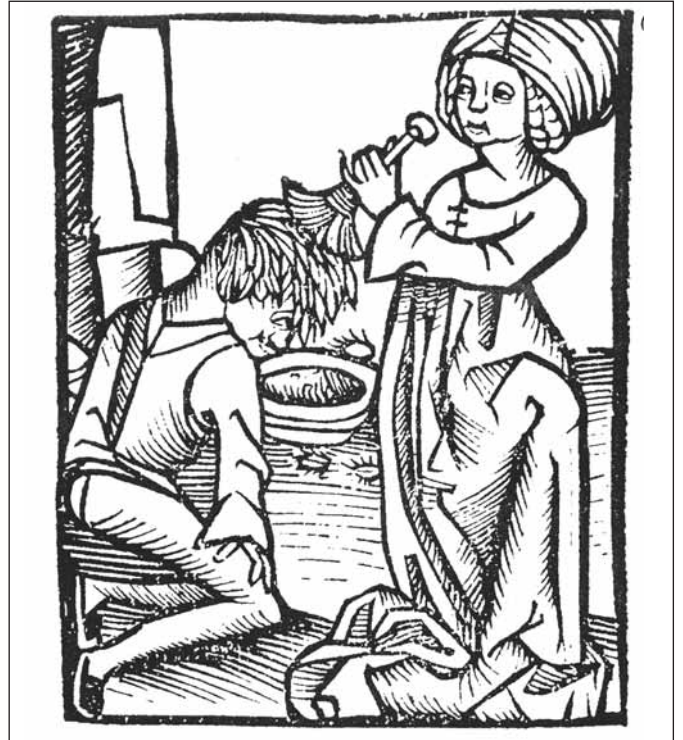
Guaritrice del Cinquecento

Persone che sono ritenute dotate di virtù particolari ottenute per via ereditaria, o perché nate settimane, o perché madri di gemelli vengono appunto considerati come dei taumaturghi che guariscono le malattie, mediante tocamenti e recite di preghiere particolari, note solo a loro o anche di semplici Pater, Ave e Gloria. Qui in Canavese erano diffuse queste figure di guaritori, specialmente donne, chiamate meisinoire o medicone , figure avvolte da un alone di mistero, si diceva che la loro magia era custodita in libri e scritti che solo loro possedevano. Fortunatamente, un "formulario magico" dell'Ottocento, appartenuto ad una meisinoira