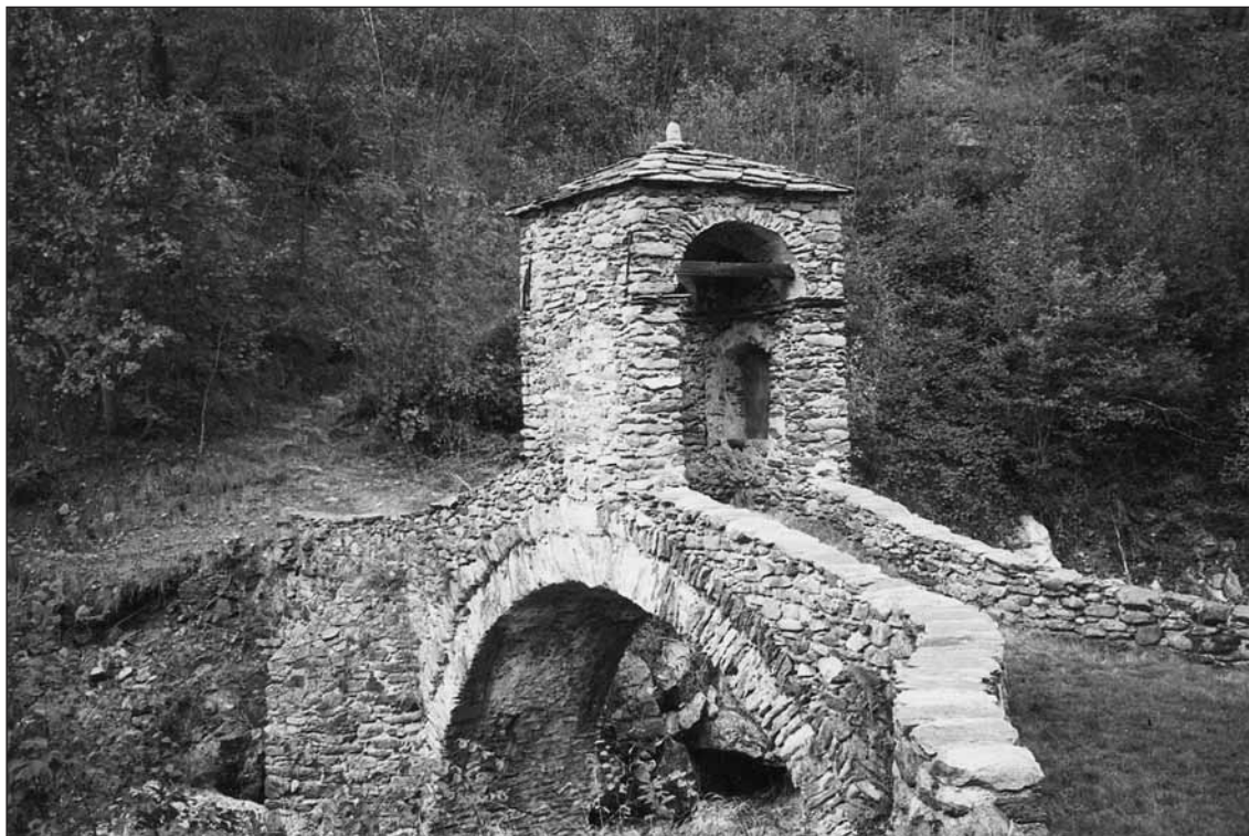
Il baldacchino del ponte

elementi di sostegno sottilissimi e con forme molto alleggerite.