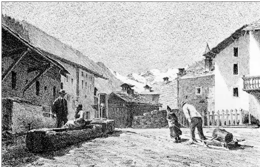
Cogne, in una litografia di D. Vallino, 1880

per scorrere sul piano inclinato, il manovratore balza agilmente sul carrello e percorre una parte della discesa e, prima che il carico abbia acquistato una velocità incontrollabile, fa in modo che il carrello risalga sulla scarpata che si trova all'estremità di ogni tratto a zig-zag, o scivolo. Allora il manovratore scende, gira il carrello in direzione del tratto successivo dello scivolo, lo spinge e quando è in movimento balza di nuovo sul veicolo per essere trasportato sino al successivo tornante: e così, con una serie di tali percorsi, il materiale raggiunge finalmente il fondovalle. A quanto sembra, questi uomini devono poi risalire a piedi la montagna, trascinandosi dietro i carrelli vuoti. Non ho mai visto una tale dispersione di forze e così mal sfruttate.