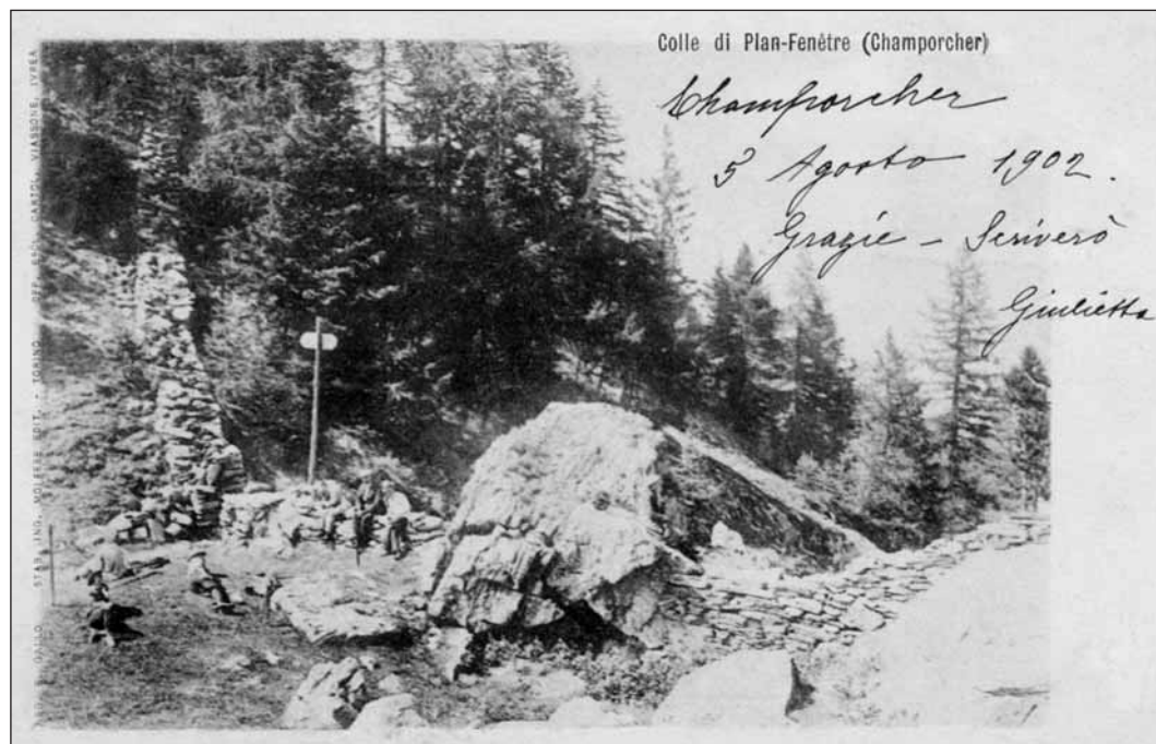
Il Colle della Finestra in una cartolina dell'inizio '900

buontempone. Gli abitanti di quella frazione sembravano in migliori condizioni e più agiati rispetto a quelli di altri comuni della parte più bassa della valle.