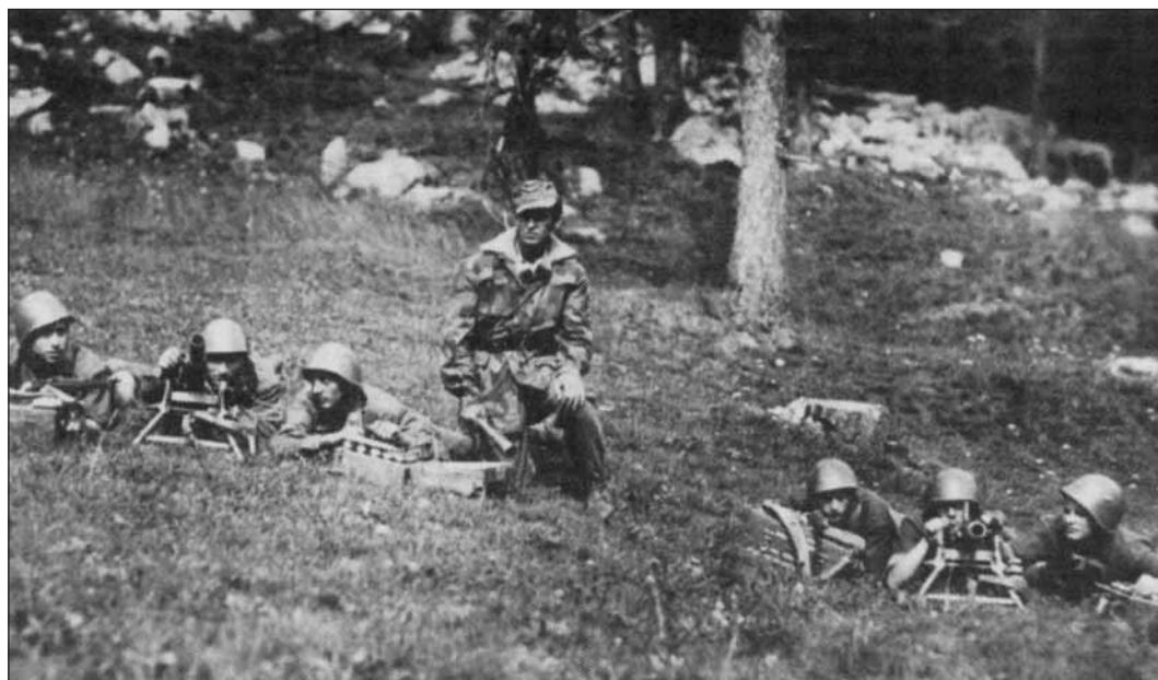
Ceresole Reale, agosto 1944. Squadra mortai del battaglione "Fulmine" - X M.A.S.