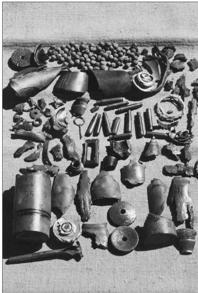
Colle della Crocetta, agosto 2001. Residui bellici del combattimento del 14 agosto 1944

Sarebbe opportuno che questi poveri, ma significativi oggetti trovassero una collocazione idonea. Nonostante il Canavese sia stata una zona fortemente