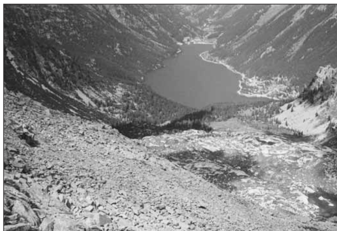
Il lago di Ceresole Reale visto dal Colle della Crocetta

valicarono il Colle della Crocetta, discesero su Ceresole e rubarono le campane della parrocchia, nella fuga i batacchi fecero suonare le campane dando l'allarme. Gli uomini di Ceresole inseguirono i ladri e raggiuntili su un piano sottostante il colle li trucidarono dopo una violenta zuffa. Da allora il piccolo pianoro ha preso il macabro nome di Piano dei Morti. Ovviamente nella Valle di Lanzo la leggenda ha una variante; i ladri non erano di Bonzo ma bensì di Ceresole che vennero a rubare le campane di Groscavallo. Da Pian dei Morti con trenta minuti di ripida salita tra crolli di grandi massi si raggiunge il colle, da dove lo sguardo può spaziare su panorami incomparabili; si intravede il lago di Ceresole incastonato nel fondovalle mille metri più in basso, le frastagliate e severe creste delle Levanne, i poderosi contrafforti che ci separano dalla Francia, la vasta prateria alpina che colora di verde l'intera zona del Nivolet, e poi davanti a noi i maestosi giganti alpini quali il Courmaon, la Cuccagna, la Becca di Monciair, il Ciarforon, la Tresenda e il maestoso massiccio del Gran Paradiso. Voltando le spalle al versante canavesano si apre sotto di noi la Val Grande di Lanzo, il pendio scende dal colle con leggera pendenza ed è coperto da una verde cotica erbosa alpina. A pochi minuti dal colle il versante si fa pianeggiante ed un piccolo laghetto ne